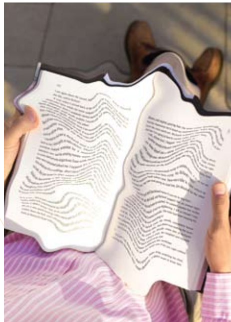
LMD bemoeilijkt het lezen.

Als u denkt dat uw gezichtsvermogen achteruitgaat, wacht niet langer om bij uw oogarts langs te gaan. Het kan gaan om de eerste symptomen van leeftijdsgebonden maculadegeneratie (LMD) en in het bijzonder de snelle en agressieve «natte» vorm (natte LMD), de meest voorkomende oorzaak van verlies van het gezichtsvermogen bij 60-plussers in de geïndustrialiseerde wereld.