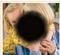
Zicht in een gevorderd stadium van LMD.

LMD kent soms een sluipende ontwikkeling. Het kan zich eerst in één oog manifesteren zonder merkbare symptomen, omdat het andere, goede oog dit compenseert. Vaak wordt het probleem pas duidelijk wanneer ook in het tweede oog symptomen optreden. Het is dan soms te laat om het eerste oog te behandelen. Daarom is het zo belangrijk om de symptomen vroegtijdig te herkennen en 60-plussers aan te sporen om jaarlijks een controle op LMD te laten uitvoeren.