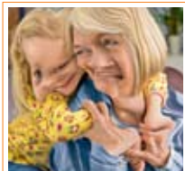
Vervormd zicht met LMD.